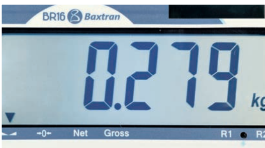
PANTALLA LCD RETROILUMINADA