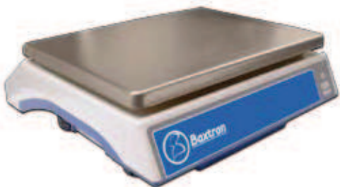
Vista trasera | Vue de derrière | Rear view