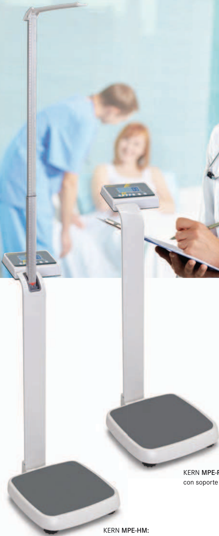
KERN MPE-PM: con soporte